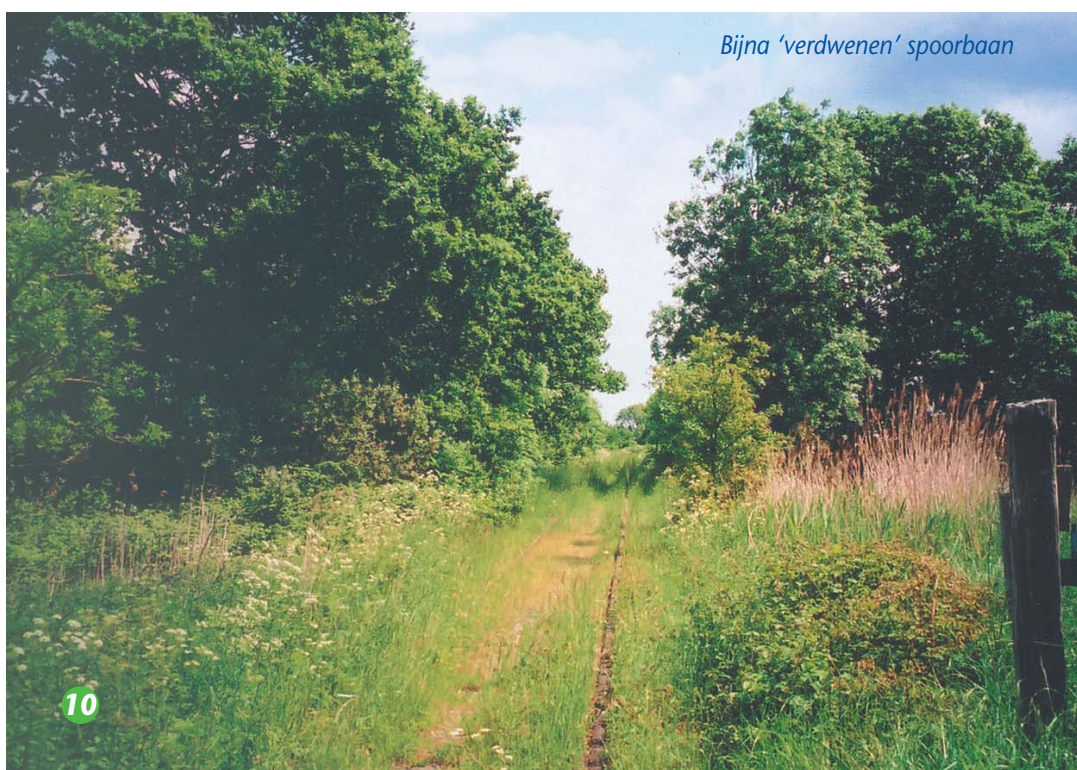
Bijna 'verdwenen' spoorbaan

De Zwake was vroeger een zeearm die na de stormvloed van 1014 en 1134, de eilanden Zuid-Beve- land en Borsele van elkaar scheidde. Tot 1445 toen er een dam door de Zwake werd gelegd, was dit een belangrijke vaarroute binnendoor naar Antwerpen. Nu heet dit water de Zwaakse Weel.