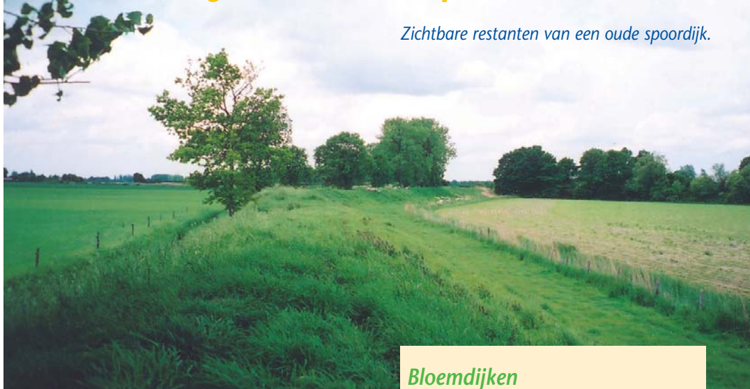
Zichtbare restanten van een oude spoordijk.